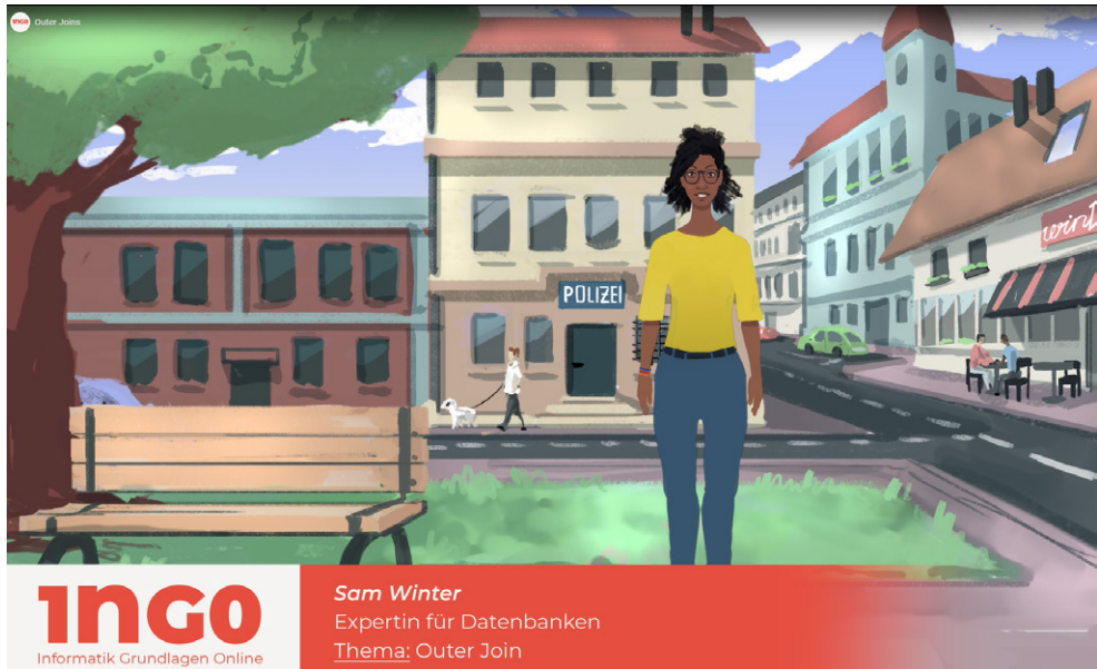
Abb. 3: Screenshot aus dem animierten MOOC „Datenbanken und Logik“ der Universität Klagenfurt

In den nächsten zwei Kapiteln geben wir einen Einblick, wie wir bei der Entwicklung, Erstellung, Erprobung und Evaluation der MOOCs im Detail vorgegangen sind.