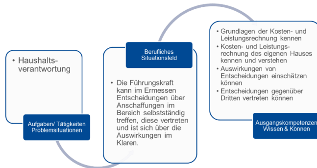
Abb. 3: Beispiel berufliches Situationsfeld „Haushaltsverantwortung“

Viele der von den Expertinnen/Experten in Interviews oder im ersten Workshop benannten Arbeitsfelder 3 , Arbeits- und Handlungssituationen und berufstypische Problemkonstellationen galt es entsprechend den wissenschaftlichen Anforderungen an ein Hochschulstudium weiterführend zu beschreiben und zu ordnen.